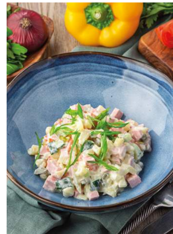
ОЛИВЬЕ С КОЛБАСОЙ / КУРИЦЕЙ