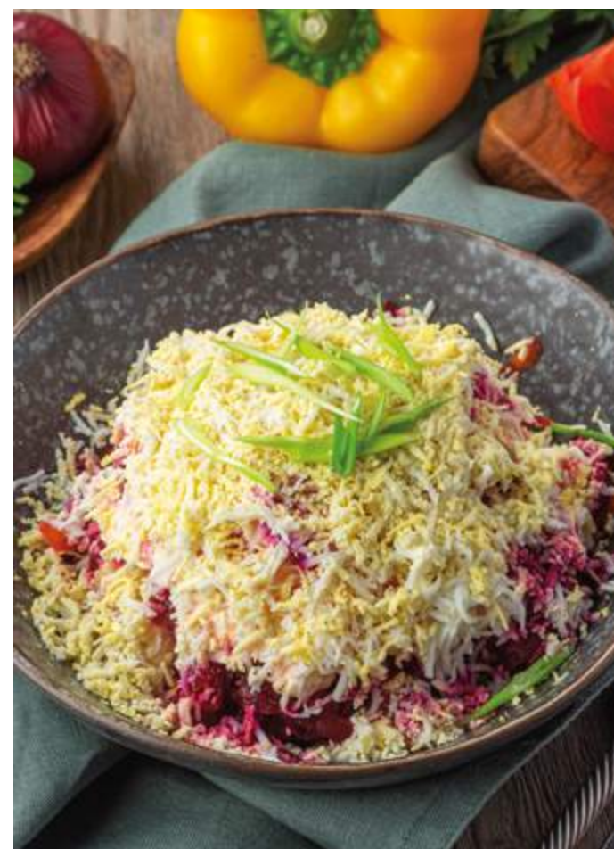
СЕЛЁДКА ПОД ШУБОЙ